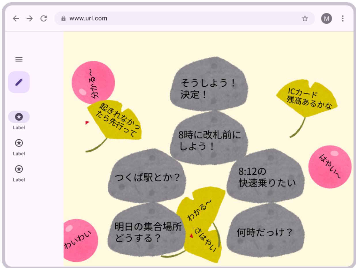
図 1 ChaosChat 概要図

位置に配置するアプローチを取る。さらに、円や色による表現では解釈が利用者依存になるという制約に対して、テキストを石や葉っぱ等の物理的メタファに格納し、その物性に応じて変化する挙動によって非言語の手がかりを表現する。これらのアプローチをすべて含み、発言の重要性と話者の意図を同時に表現できる非線形なチャット構造を持つテキストチャットである ChaosChat (図 1) を提案する。