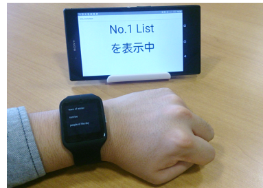
図 4. 音楽プレイヤー操作画面

B2B-Swipe を入力手法として用いた音楽プレイヤーを示す(図 4)。ユーザはこの音楽プレイヤーを B2B-Swipe を使ってアイズフリーにて操作することが可能である。音楽プレイヤーは曲リスト選択画面および曲操作画面という 2つの画面により構成されている。B2B-Swipe と実装した機能との対応を表 2 に示す。