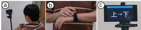
図 2. 実験姿勢および指示画面

被験者にはタスクを図 2a, b に示す姿勢にて行って貰った。タスクの 1 試行を 1 回の B2B-Swipe とし, 16 試行を 1 セッションとした。各セッションにおいて, 16 通りの B2B-Swipe をランダムに 1 回ずつ提示した。提示には三脚に固定されたスマートフォンを用いた (図 2a, c)。