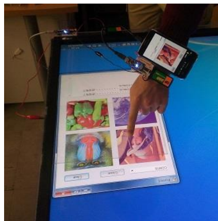
図 3 : 通信の様子

複数人による動作テストを行ったところ、指先が触れていれば安定して通信を行うことができた。どちら向きの通信の場合も通信速度はおよそ 2KB/s となった。図 3 は実際にテーブルトップ PC からウェアラブルデバイスへの画像の送信を行った様子である。正しく通信が行われたため、ユーザが触れた画像がウェアラブルデバイスにも表示されている。